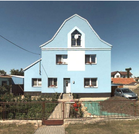
Sousední dům, převzatá architektura